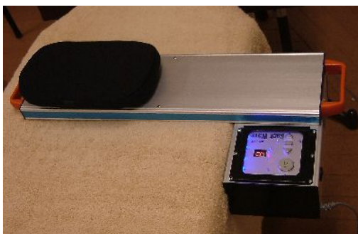
新型バックウェーヴ

昨秋に開節法マシンの基本3種が揃った。おかげで施術の労力が半減し、施術の効果が倍増した。